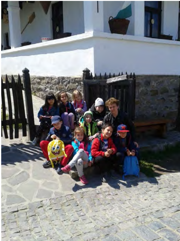
A perces ház előtt megpihent a csapat.