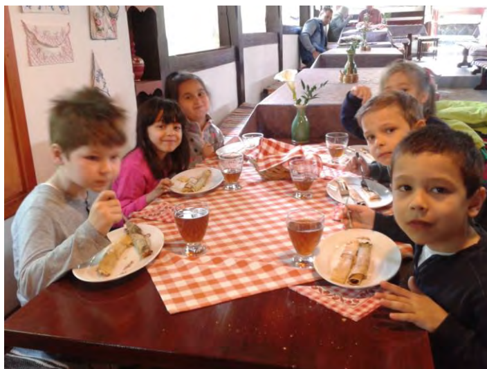
A palóc gulyás és a palacsinta a Muskátli vendéglőben.